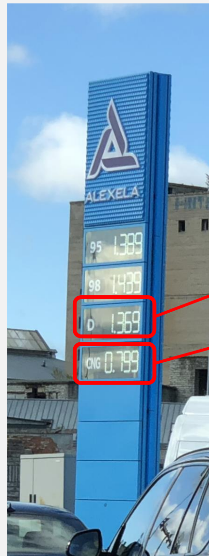
CNG versus diesel -58%