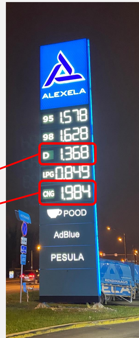
CNG 150% hinnatõus